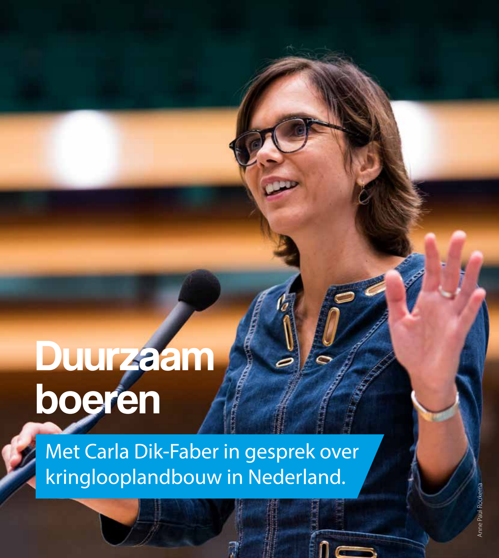
Anne Paul Roukema